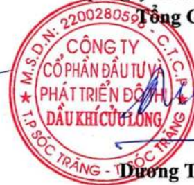
Dương Thế Nghiêm