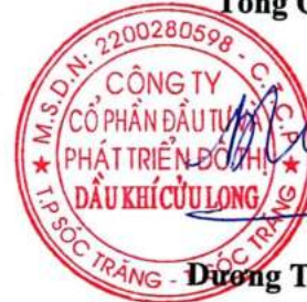
Dương Thế Nghiêm