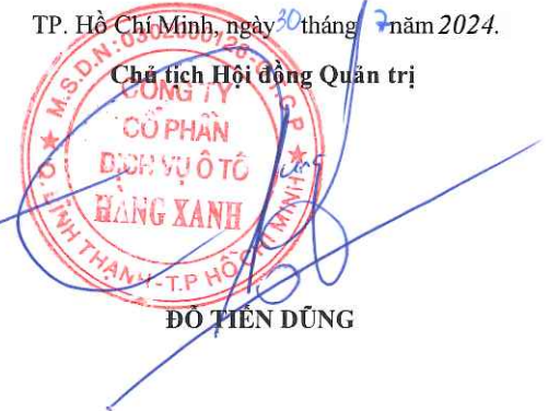
ĐỖ TIÊN DŨNG