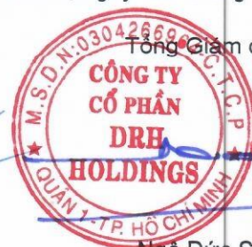
Ngô Đức Sơn