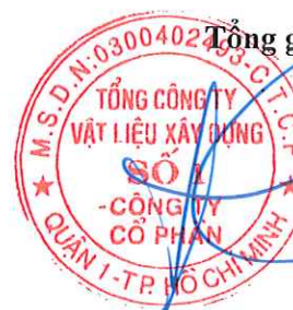
Cao Trường Thụ