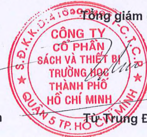
Từ Trung Đan