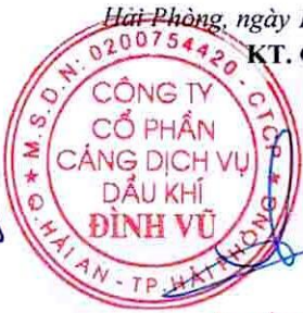
Đặng Kiến Nghiệp