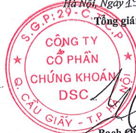
Bạch Quốc Vinh