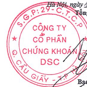
Bạch Quốc Vinh