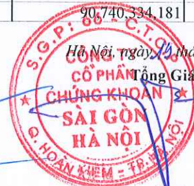
Nguyễn Chí Thành