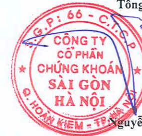
Nguyễn Chí Thành