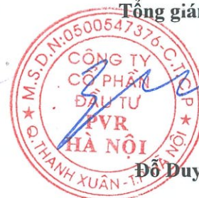
Đỗ Duy Điền