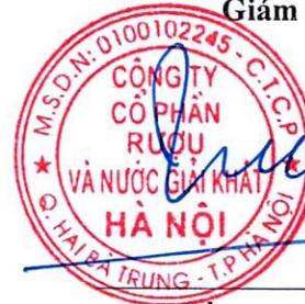
Trần Hậu Cường