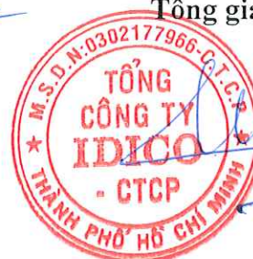
Đặng Chính Trung