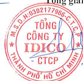
Đặng Chính Trung