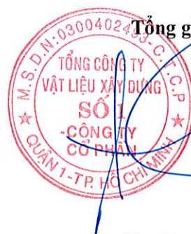
Cao Trường Thụ