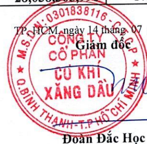
Đoàn Đắc Học