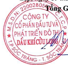
Dương Thế Nghiêm