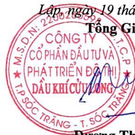
Dương Thế Nghiêm