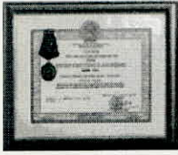
HUÂN CHƯƠNG LAO ĐỘNG HẠNG NHẤT