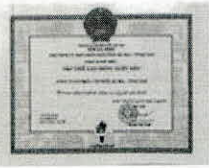
TẬP THỂ LAO ĐỘNG XUẤT SẮC