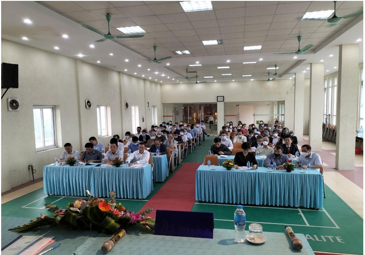
Hội đồng quản trị và Ban kiểm soát nhiệm kỳ 2022-2027.