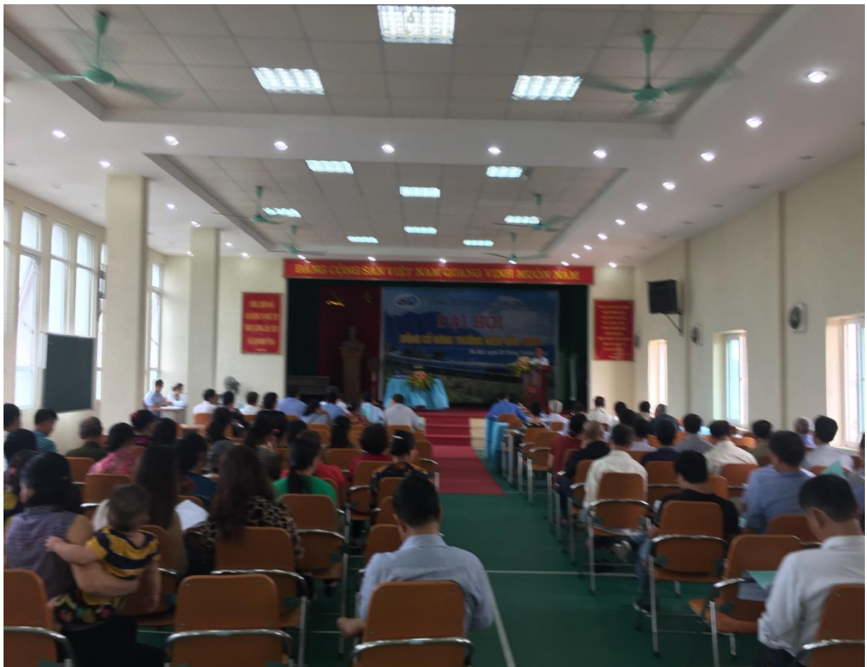
Hình ảnh Đại hội đồng cổ đông thường niên năm 2021: