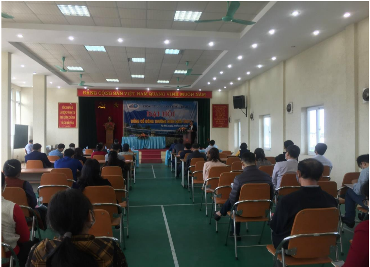
Hình ảnh biểu quyết bầu bổ sung thành viên thành viên Hội đồng quản trị