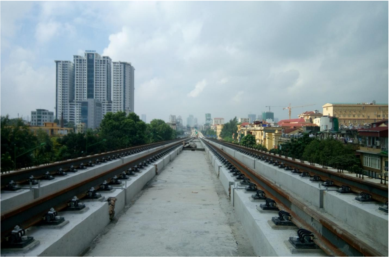
* Hình ảnh sản xuất Tà vẹt bê tông dự ứng lực tại Cỗ Loa Đông Anh :