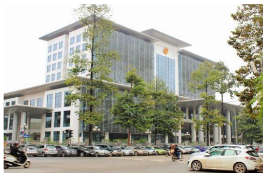
Nhà làm việc Quốc hội (Hà Nội)