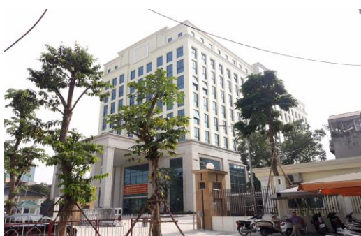
Trụ sở Kho bạc Nhà nước Hà Nội