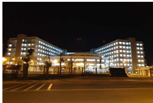
Bệnh viện sản nhi Long An