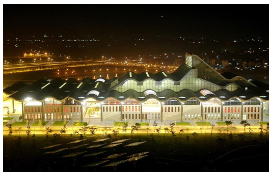
Trung tâm Hội nghị Quốc gia (Hà Nội)