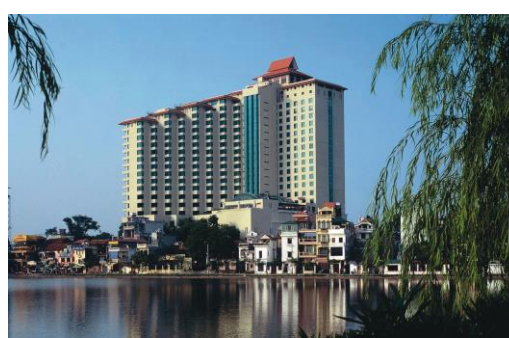
Khách sạn Pan Pacific Hà Nội