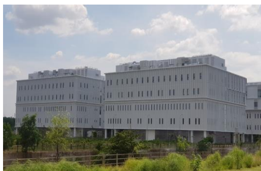
Trường Đại học Việt Đức (Bình Dương)