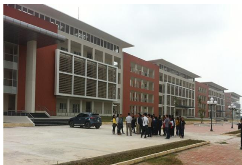
Đại Học Thủy Lợi cơ sở 2 – Hưng Yên