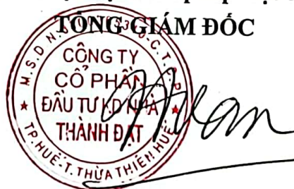
Võ Phi Hùng

Xác nhận của đại diện theo pháp luật của Công ty