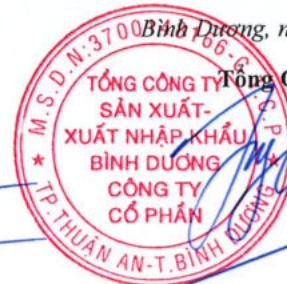
Nguyễn Thị Kim Phượng