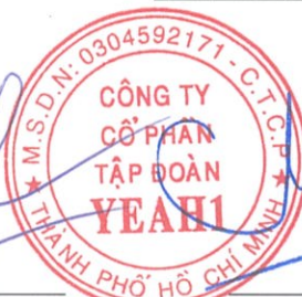
Chế Đoàn Viên Phó Tổng Giám đốc Ngày 25 tháng 04 năm 2024

Các thuyết minh từ trang 8 đến trang 55 là một phần cấu thành báo cáo tài chính hợp nhất giữa niên độ này.