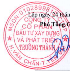
Trần Huyền Trang