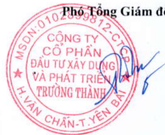
Trần Huyền Trang