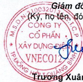
Trương Xuân Phúc