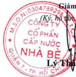
Lý Thành Tài