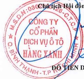
ĐỖ TIẾN DŨNG