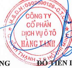
ĐỖ TIÊN DŨNG