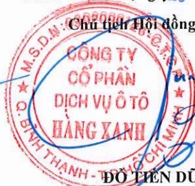
ĐỖ TIẾN DŨNG