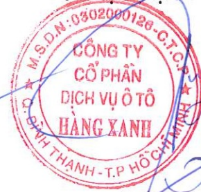
ĐỖ TIẾN DŨNG