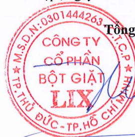
Cao Thành Tín