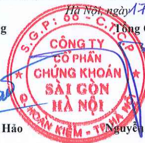
Nguyễn Chí Thành