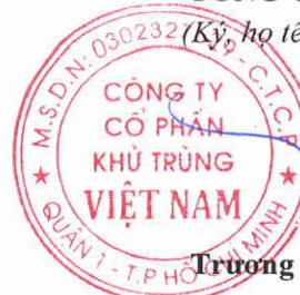
Trương Công Cứ