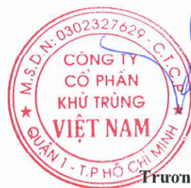
Trương Công Cứ