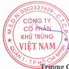
Trương Công Cứ