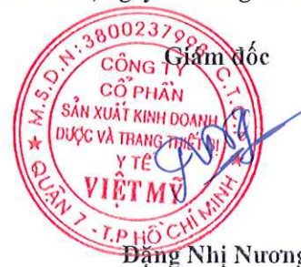
Đặng Nhị Nương