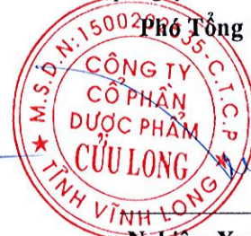
Nghiêm Xuân Trường