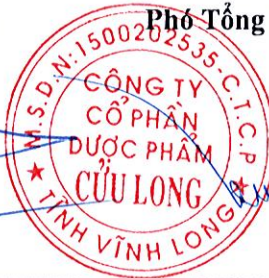
Nghiêm Xuân Trường