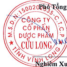
Nghiêm Xuân Trường