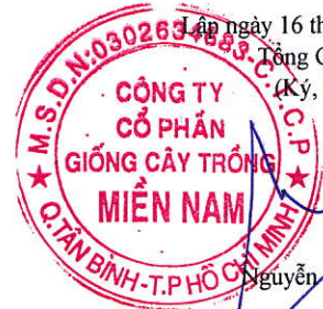
Lâm Tuấn Lạc