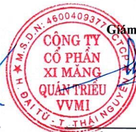
Trần Việt Cường