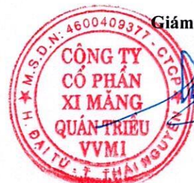
Trần Việt Cường