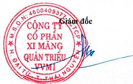
Trần Việt Cường