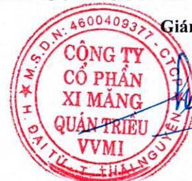
Trần Việt Cường