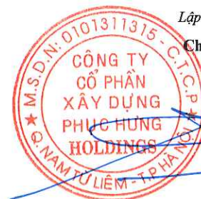
Cao Tùng Lâm