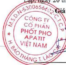
Đặng Tiến Đức