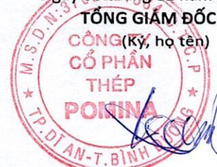
ĐỖ TIẾN SĨ