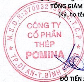
ĐỖ TIẾN SĨ