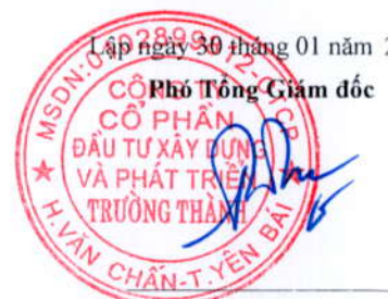
Trần Huyền Trang