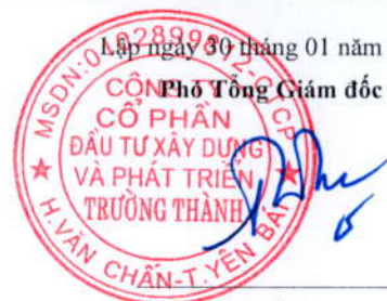
Trần Huyền Trang