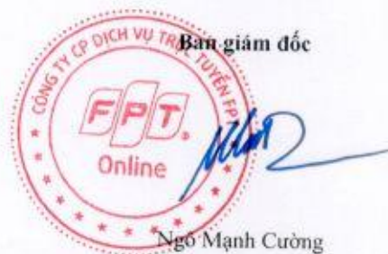
Ngô Mạnh Cường