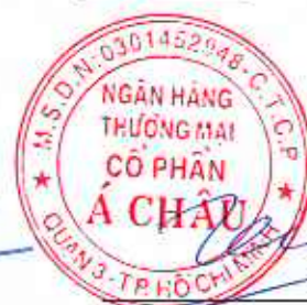
Trần Hùng Huy Chủ tịch Hội đồng Quản trị Ngày 10 tháng 8 năm 2023

Các thuyết minh từ trang 11 đến trang 83 là một phần hợp thành báo cáo tài chính riêng giữa niên độ này.