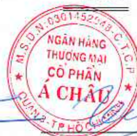
Trần Hưng Huy Chủ tịch Hội đồng Quản trị Ngày 10 tháng 8 năm 2023