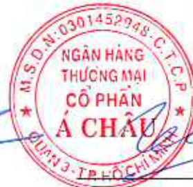
Trần Hùng Huy Chủ tịch Hội đồng Quản trị Ngày 10 tháng 8 năm 2023