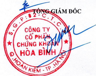
Đinh Thế Lợi