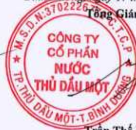
Trần Thế Hưng