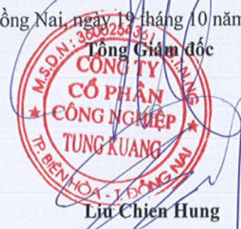
Lưu Chiến Hưng