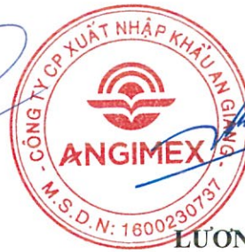
LƯƠNG ĐỨC TÂM