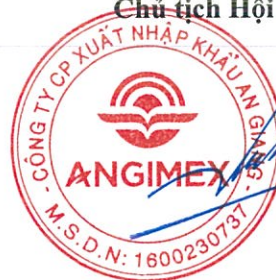
LƯƠNG ĐỨC TÂM