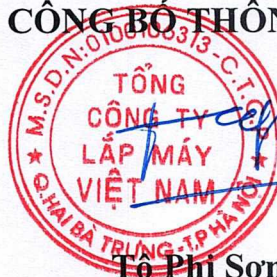
Tô Phi Sơn