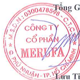
Lưu Tiên Cáo