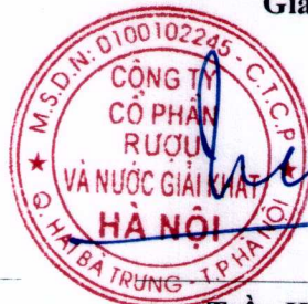
Trần Hậu Cường