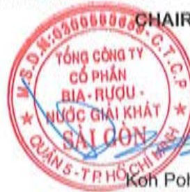
Koh Poh Tiong