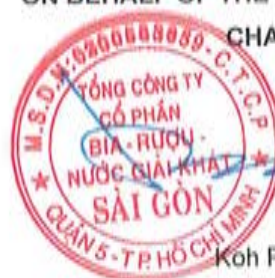
Koh Poh Tiong