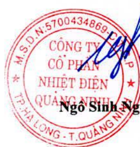
Ngô Sinh Nghĩa