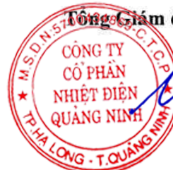
Ngô Sinh Nghĩa