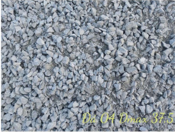
ĐÁ 0 x 4 dmax 37,5mm