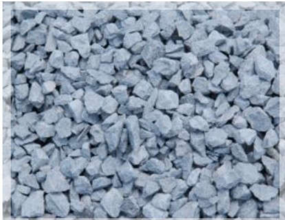
ĐÁ 1 X 2