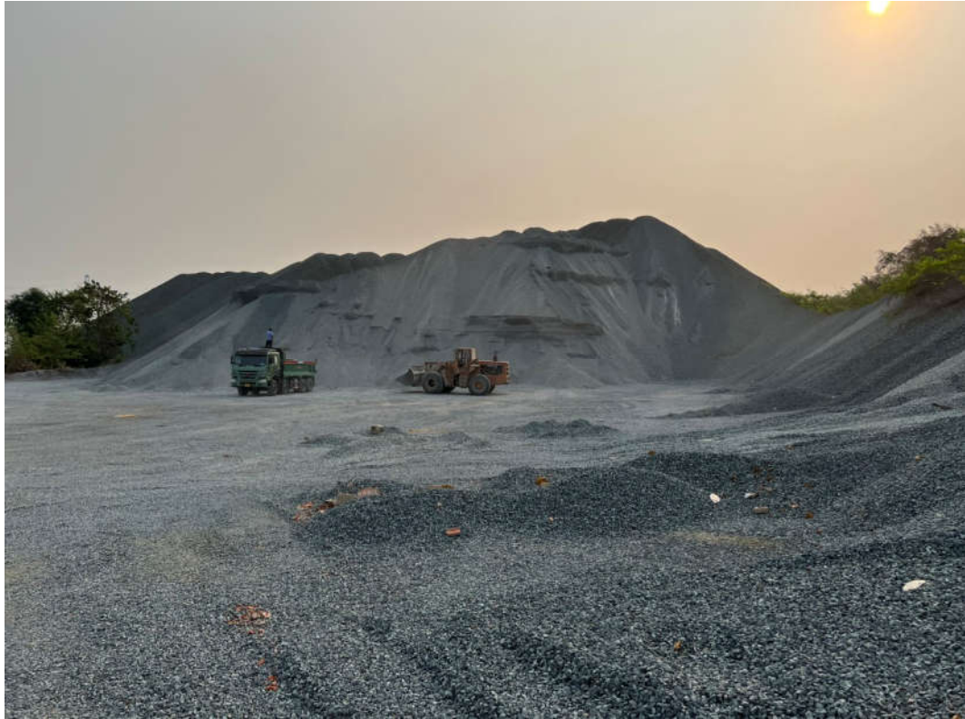
Đá 1x2 tại mỏ Núi Nhỏ ( 170.000 m 3 )

+ Quản lý và khai thác những phần đất của Công ty nằm ngoài ranh mỏ. Hoạt động bán sản phẩm tại mỏ Núi Nhỏ: