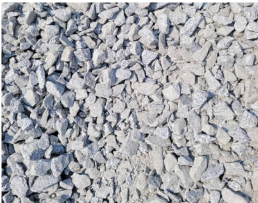
ĐÁ 0 x 4