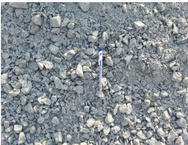
ĐÁ 0 x 4 dmax 25 mm