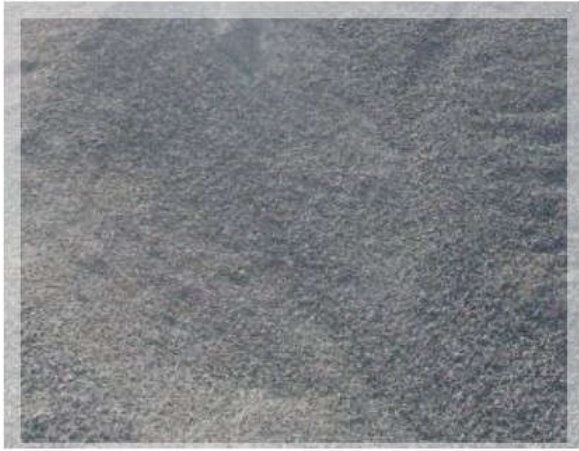
Đá Mi Bụi