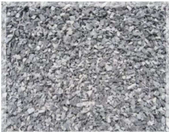
ĐÁ MI SÀN ( ĐÁ 3 X 8 )