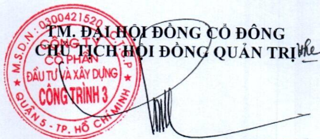
Trần Quốc Đoàn

Các ông (bà) thành viên Hội đồng quản trị, Ban kiểm soát, Ban điều hành và toàn thể cổ đông Công ty cổ phần Đầu tư và Xây dựng công trình 3 chịu trách nhiệm thi hành Nghị quyết này và tổ chức triển khai theo thẩm quyền, chức năng hoạt động của mình phù hợp với quy định của pháp luật và Điều lệ tổ chức hoạt động của Công ty cổ phần Đầu tư và Xây dựng công trình 3.